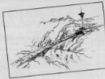
Et 200 meter høyt tårn som første møte med Norge på Svinesund vil bli en stor turistattraksjon og skape turisme i tettete grensregioner sammen med ny Svinesundbrua. Illustrasjon Gunnar Iben Johnsen.